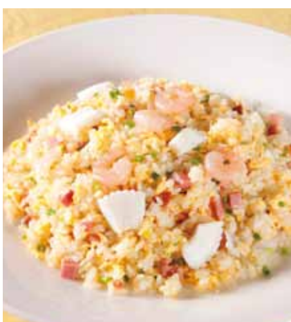
五目チャーハン [ 什錦香炒飯 ]

Fried noodles with sautéed mixed vegetables _____ 1,000円