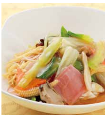
五目あんかけ焼きそば [ 什錦扒炒麵 ]

Sweet and Sour Pork (Sweet or Brown Vinegar) _____ 1,200円