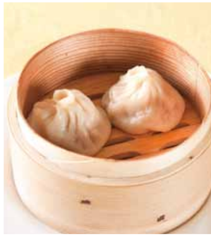
ショウロンポー〈2個〉 [ 小籠包 ]