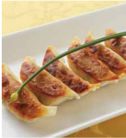
焼餃子〈6個〉 [ 鍋煎焼餃子 ]