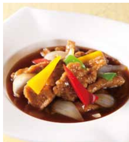
すぶた〈甘酢・黒酢〉 [ 古佬肉 ]

Bean curd in Szechwan style (mabo-dofu) _____ 1,000円