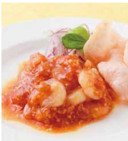
海老のチリソース炒め [ 乾焼炒蝦仁 ]

Prawns in Chinese chili sauce _____ 1,500円