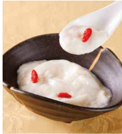
杏仁豆腐 Almond Jelly