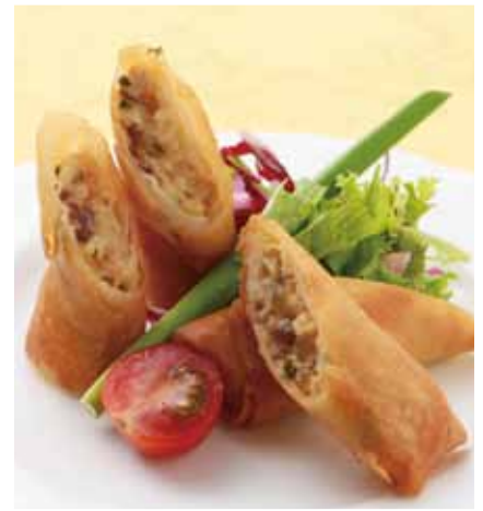
春巻き〈2個〉 [ 三絲炸春巻 ]