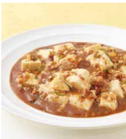
マーボー豆腐 [ 陳麻婆豆腐 ]

Bean curd in Szechwan style (mabo-dofu) _____ 1,000円