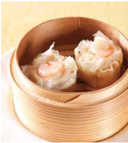
海老しゅうまい〈2個〉 [ 蝦仁鮮焼売 ]