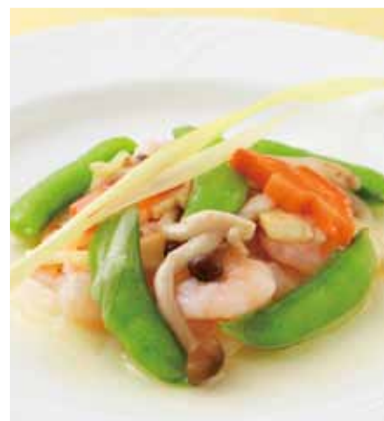
海老と季節野菜のあっさり炒め [ 時菜炒蝦仁 ]

Prawns in Chinese chili sauce _____ 1,500円