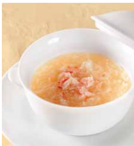
蟹肉入りフカヒレスープ [ 蟹肉魚翅 ]

Shrimp and vegetables light sauté _____ 1,500円